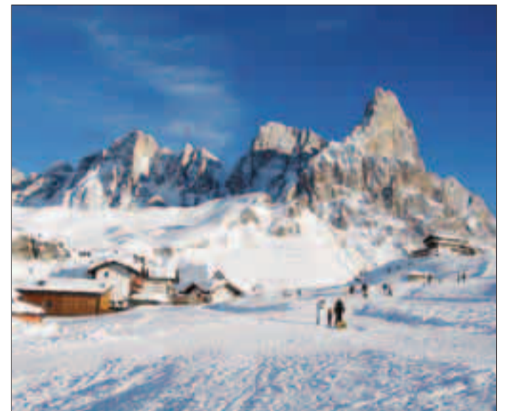
Una veduta invernale di Passo Rolle

più opportunamente localizzati alla quota degli impianti più bassi, in corrispondenza di Malga Rolle». Il gallo forcello: «L'articolo 60 delle Norme di attuazione riprende il criterio del divieto di caccia rivolta a specie come la lepre variabile, la lepre comune e l'avifauna in genere, tranne il caso del fagiano di monte, nel caso in cui la specie presenti un indice riproduttivo maggiore o uguale a 2 nel rapporto pulli/femmine adulte». Permetterla la caccia, secondo Italia Nostra, è «in palese contraddizione con i dati riportati sui formulari Natura 2000 relativi a Sic e Zps interessanti il