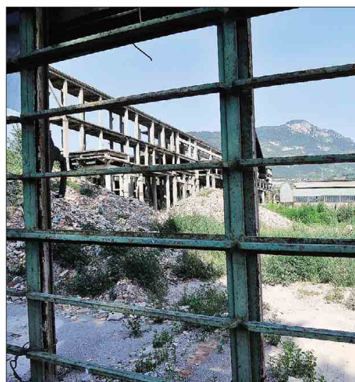
Dalle coperture dei capannoni sono state tolte le lastre di amianto, ora le strutture

zione, posto lungo una via altamente trafficata all'ingresso della città, e per caratteristiche che rappresenta indubbiamente uno sfregio nel tessuto urbano. Soprattutto da quando, per evitare che diventasse un malsano rifugio per senzatetto, nel novembre del 2011 l'edificio fu privato di facciate e serramenti diventando un relitto simile a quelli colpiti dai bombardamenti nella guerra di Bosnia.