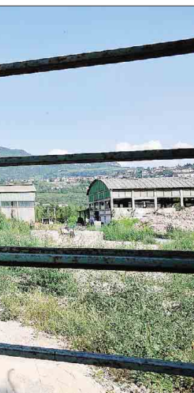
possono essere abbattute