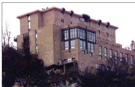
L'ex Hotel Panorama di Sardinia si affaccia sulla città