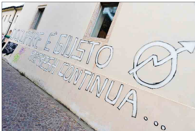
L'ex mensa del centro Santa Chiara è stata occupata due volte dai collettivi studenteschi

che comunque avrebbe finanziato il trasloco solo dopo il 2020, ha deciso di cambiare rotta ipotizzando il trasferimento della scuola nell'edificio ex aziende agrarie a Maso Ginocchio. Dunque l'ex mensa rimane a disposizione dell'idea migliore, tenendo conto che per rimettere a nuovo l'edificio sarà necessario spendere parecchi soldi. A proposito di Maso Ginocchio, accanto all'edificio moderno, che ospita il Brico Center, la Trentino School of Management, un'assicurazione e uffici vari, sorge la parte antica, ormai piuttosto malandata e in passato usata come rifugio dai senzatetto. Non è chiaro se anche questa parte