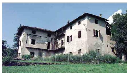
Maso Tasin, edificio abbandonato all'interno del parco di Gocciadoro

Poi la riconversione e la trasformazione in sede della Trentino School of Management, fino al nuovo abbandono nel 2012. Da allora le ipotesi si sono succedute l'una all'altra, mentre l'incuria e gli agenti atmosferici iniziavano a intaccare l'edificio. Si è parlato di farne un casinò, una discoteca per la movida studentesca e adesso la sede di un'associazione sociale con annesso asilo nido e ristorante. Ma non è detto che sia la scelta definitiva viste le perplessità e le critiche emerse all'indomani dell'annuncio. Più deflata, in cima al Parco di Gocciadoro, un'altra struttura abbandonata da decenni è Maso Tasin. Di proprietà del Comune, qualche anno fa era stato oggetto di una convenzione con il vicino Villaggio Sos che ne prevedeva la completa ristrutturazione per ricavarne degli alloggi da assegnare alle «mamme» operatrici del villaggio in età da pensione. Poi però i venti di crisi hanno finito per abbattere anche questo progetto. Nei mesi scorsi il presidente della circoscrizione Oltrefersina, Emanuele Lombardo, ha rilanciato l'idea di ristrutturare, magari per farne aule didattiche legate al parco e un bar. Si attende risposta. F.G.