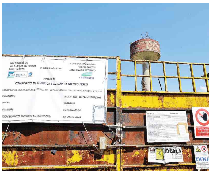
Nella foto sopra il titolo l'ex Euromix, qui sopra l'ingresso dell'ex Sloi