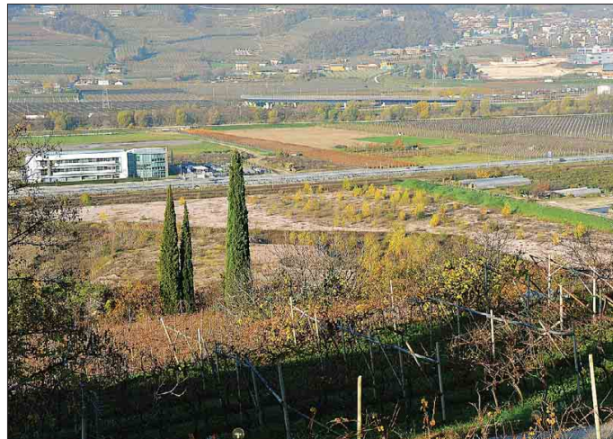
Uno scorcio della grande area in località San Vincenzo a Mattarello dove potrebbero sorgere stadio e lido

Ora bisognerà approfondire. La nostra cooperativa per quanto ci riguarda assicura di andare avanti con il cuore e la passione per dare a Trento e ai trentini qualcosa di bello e liberare un'area strategica come quella del Briamasco». Nelle ipotesi avanzate dal governatore Ugo Rossi e dall'assessore Mellarini nei 23 ettari dell'area San Vincenzo di Mattarello ci starebbe bene anche il nuovo polo acquatico con piscine e lido estivo. Una ipotesi che Giacca chiarisce di non avere nella borsa dei progetti. Ne ha parlato anche lui come idea ma non per proporsi per realizzarla. Un equivoco che