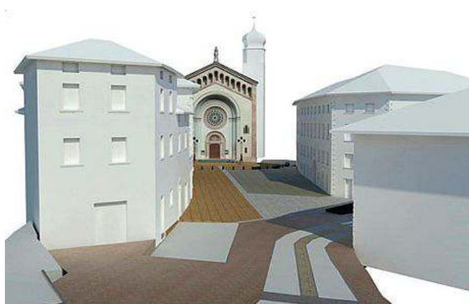
Nel rendering come diventerà entro l'anno Piazza della Chiesa

no nella zona pedonale ma in grado di “scomparire” in caso di emergenza. A riempire la piazza verranno posizionate delle sedute decorate con fiori e rimovibili in caso di manife-