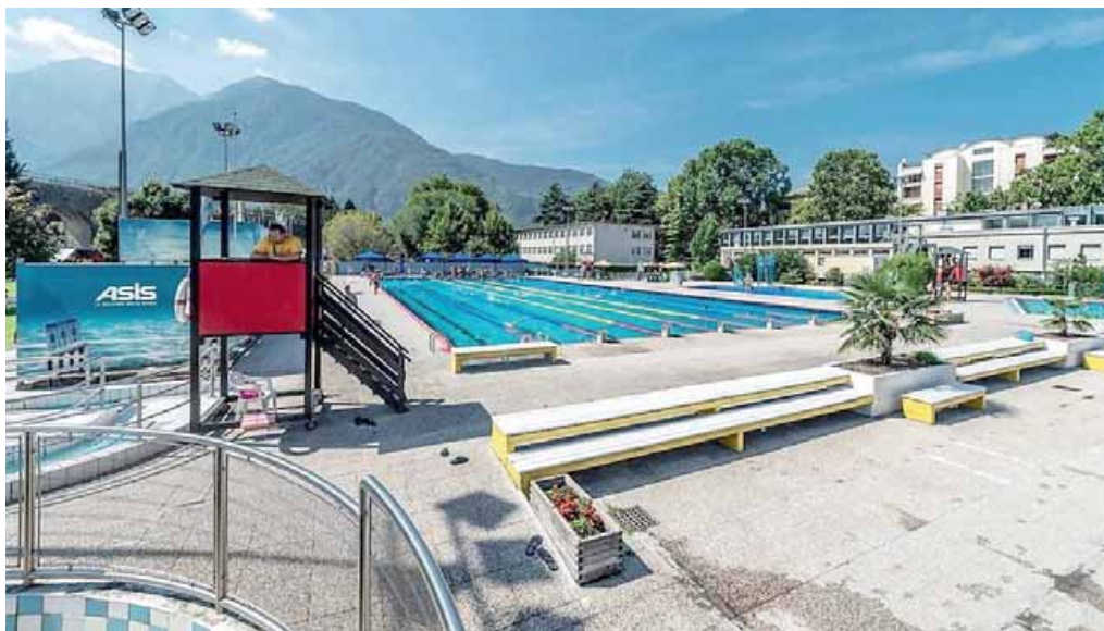
Gli spazi esterni saranno utilizzati in modo più razionale per migliorare le proposte ludiche

spirali ed arrivo in vasca ed un multipista rettilineo con arrivo a canale, uno "spray park" destinato ai più piccoli in ampliamento della piscina baby esistente ed un generatore di moto ondoso artificiale che verrà installato nella vasca esistente da