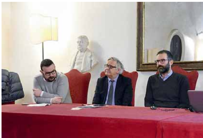
La presentazione del progetto sulla piscina Manazzon