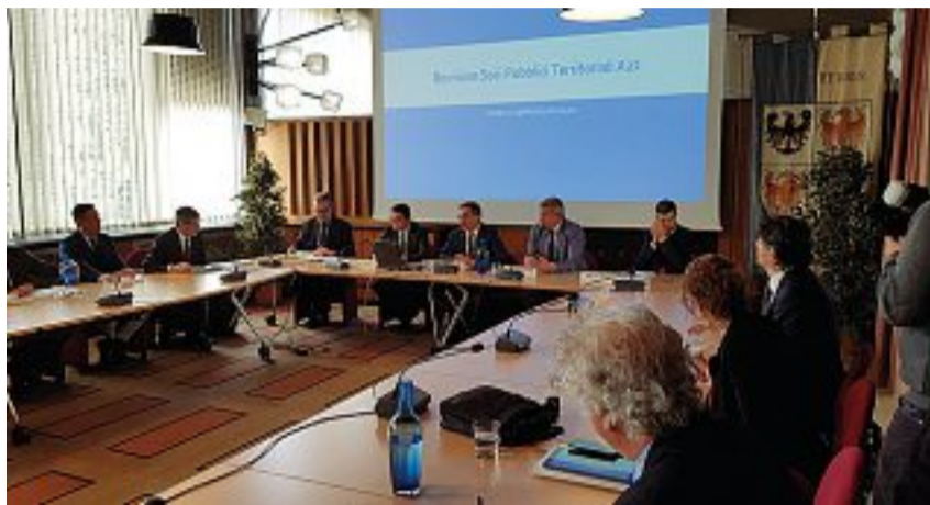
In Regione L'incontro dei soci dell'Autostrada del Brennero di ieri prima della partenza di Kompatscher per Roma

Fumata (quasi) bianca dal vertice di Roma. I soci: proroga del cda a 14