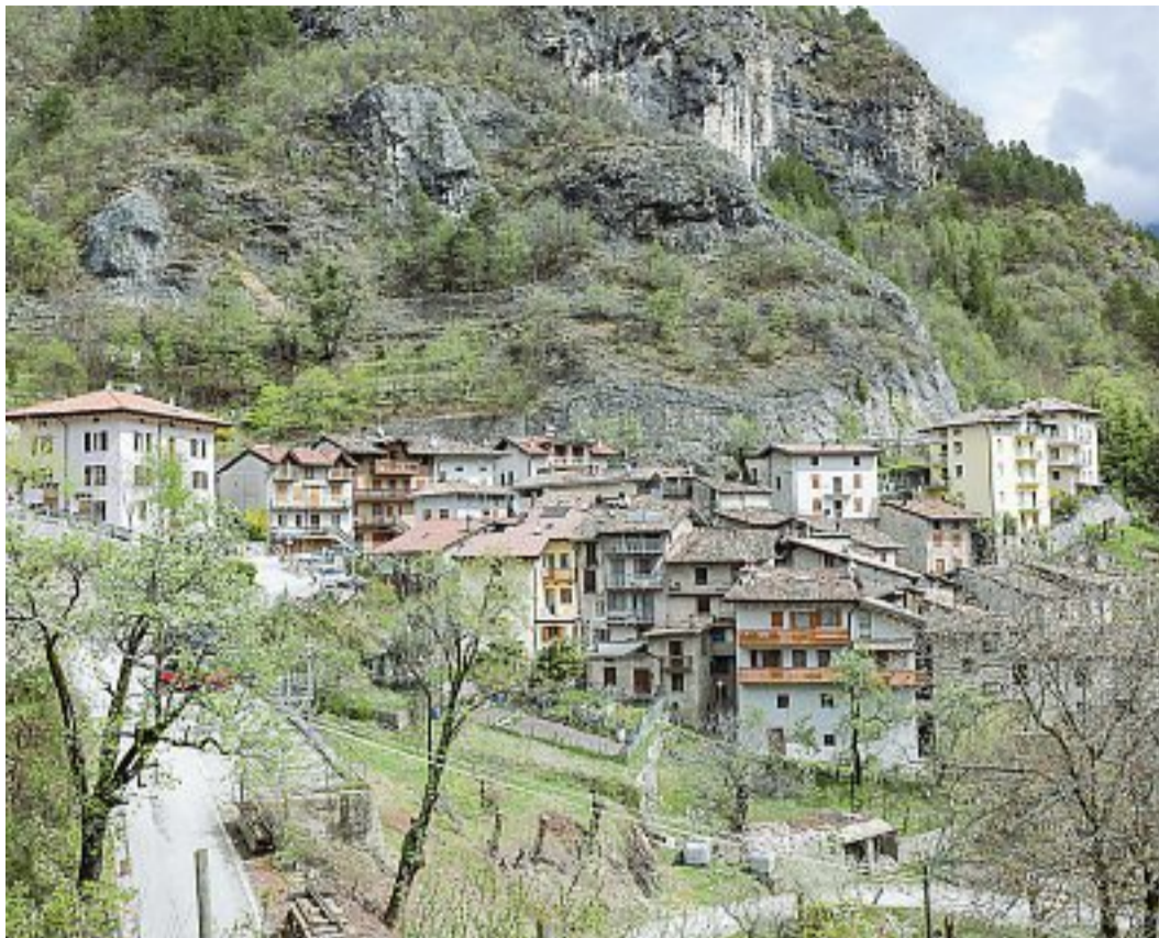
Rischio idrogeologico A destra una recente frana nell'area del possibile tracciato della Valdastico; sopra la frazione Valduga del Comune di Terragnolo; a destra la diga di Trambileno: la Pirubi dovrebbe passare vicino