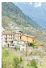
Arroccato Uno dei paesi del Comune di Terragnolo

La barista: «Ora sentiamo il fiume, domani le auto» L'assessore: «Territorio fragile»