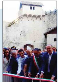
Da ieri dopo 20 anni di restauro, Castel Belasi è tornato ad essere fruibile al pubblico. Grazie ai dieci milioni di euro pubblici, il piccolo paese di Campodenno può entrare nel giro dei castelli della Val di Non