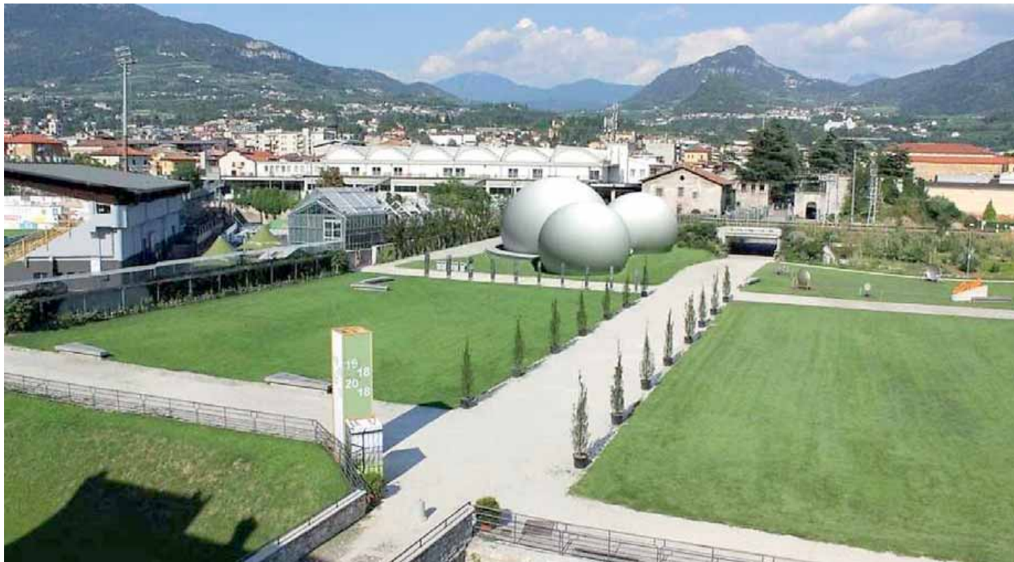
• La collocazione originale del planetario H2O era sul prato principale tra Muse e Palazzo Albere: aveva incassato il no sia di Zecchi che di Sgarbi