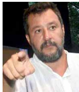
• Matteo Salvini oggi è a Pinzolo

Il leader leghista oggi è a Pinzolo. Questa sera interviene alla festa del partito: «Sì, ferie ne ho fatte poche, ma io preferisco stare tra la gente. E a Roma ho sentito già parlare di patrimoniale» > A pagina 15