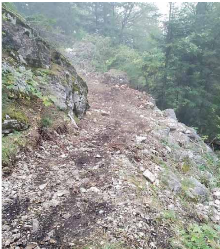
• Una delle immagini che corredano l'interrogazione di Zeni, Pd