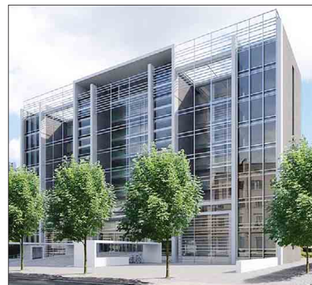
Il progetto del polo degli uffici tecnici al posto della Civica Casa di Riposo

partire dopo l'estate con la raccolta delle offerte, nella scelta delle quali si cercherà di valorizzare la parte tecnica. Di pari passo dovrebbe procedere anche la definizione della cittadella della creatività, in fase di progettazione esecutiva all'interno dell'ex Facoltà di Lettere, nell'ala nord del Centro culturale S. Chiara. Nei tre piani fuori terra sorgeranno un centro di produzione e educazione all'immagine, spazi per la musicoterapia con i bambini e di welfare culturale per l'invecchiamento attivo, residenze per scrittori, registi, fotografi, artisti invitati a Trento per progetti che coinvolgano la città, le scuole, musei, ospedale, carcere. Infine le classi pop, rock, jazz del Conservatorio cittadino. Per la riqualificazione energetica e la riorganizzazione degli spazi interni il costo preventivato è di 3,8 milioni di euro. F.G.