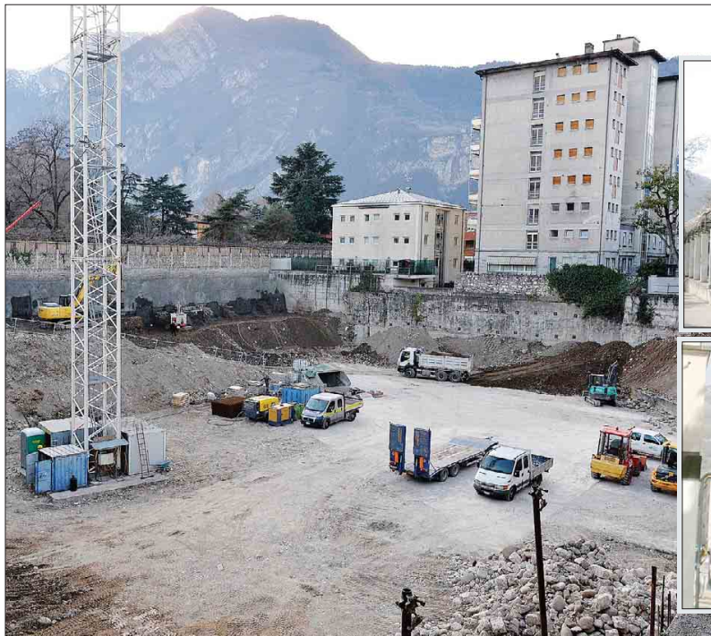
L'area ex Sordomuti oggi (foto grande) e domani nei due rendering qui sotto

Previsti 332 posti auto interrati, volumi su quattro piani fuori terra per oltre trentamila metri cubi e una fascia verde in mezzo