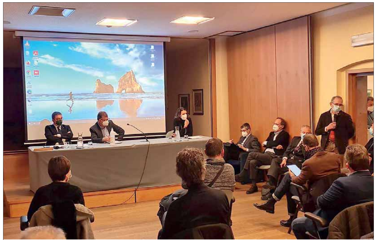
L'incontro di ieri in municipio a Predazzo fra il presidente Fugatti, l'assessora Segnana e gli amministratori

Alla fine dell'incontro Benetollo ha anche detto che è stato stanziato 1,2 milioni per riqualificare il pronto soccorso di Cavalese. «Questo - osserva Finato - è un elemento che non può che fare piacere, perché va nel segno della concretezza e della risoluzione dei problemi che ci sono. Dunque lo colloco con piacere, anche perché i lavori dovrebbero partire molto presto».