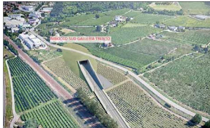
Il rendering della circonvallazione ferroviaria, nell'uscita a sud della galleria

Sono stati fatti degli sforzi apprezzabili, ma le criticità restano importanti, perché la circonvallazione ferroviaria risponda a criteri di sostenibilità e salute ambientale. Questa la posizione dell'assemblea provinciale di Sinistra italiana, davanti alle proposte del Comune di Trento, che saranno portate alla conferenza dei servizi. «Ci sembra che gli interventi proposti siano del tutto insufficienti e talvolta anche velleitari - scrive Sinistra italiana - Lo sono il prolungamento della galleria artificiale di soli 150 metri, quando la richiesta era quella di continuare fino a dopo Gardolo, per evitare che cittadine/i della stessa città avessero trattamenti diversi. Lo è la realizzazione delle collinette verde progettata per coprire il tratto di linea a nord del viadotto Canova, per circa 400 metri, che "maschera" ma non risolve il problema. Lo è infine "la predisposizione dei "camerini" nella parte