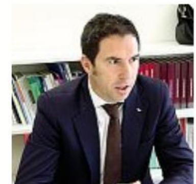
© RIPRODUZIONE RISERVATA

L'imprenditore Oggi si cerca relax e silenzio. Magari un giorno potremmo avere la corsa della Trento-Bondone con le macchine elettriche