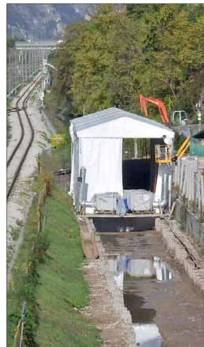
La bonifica del rio Lavisotto a Trento

raggiungimento degli obiettivi di qualità, considerando, per i corpi idrici ?uviali, i quattro comparti dove è necessario intervenire: depurazione civile, scarichi industriali, agricoltura e alterazioni idromorfologiche (quelle legate alla necessità di garantire la sicurezza idraulica e agli interventi di regimazione e di sfruttamento idroelettrico). Nel Pta si citano anche i dati di monitoraggio della presenza di Pfos nei corpi idrici del basso Chiese , per dire che solo al termine degli studi in corso, anche sulla sorgente dell'inquinante, saranno indicati interventi mirati.