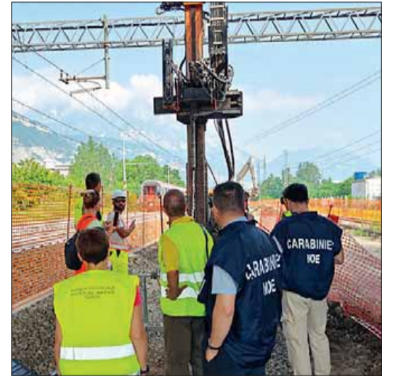
Sopra i carotaggi iniziati lungo i binari a nord del sovrappasso di Nassirya e tra i due Siti di interesse nazionale ex Sloi ed ex Carbochimica. A sinistra la carta delle criticità contenuta nel Piano generale di utilizzo acque pubbliche

colare nelle aree critiche, senza una precisa analisi di rischio e un attento piano di caratterizzazione. A tutti ma a quanto pare non a Rete ferroviaria italiana, che nel Progetto di fattibilità tecnica economica della circonvallazione ferroviaria aveva fin da subito mostrato una certa qual