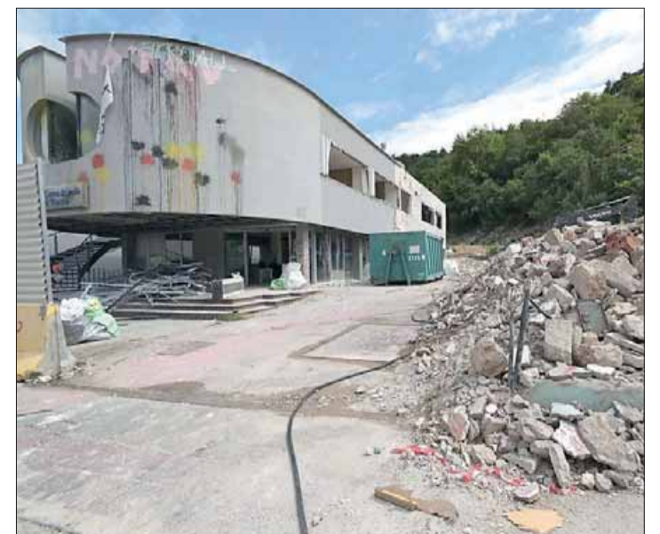
L'ex Cassa rurale. A sinistra le macerie del Moto salone

Poi in futuro al posto di questa fetta del quartiere di San Martino sorgerà una grande piazza, con i treni merci che passeranno poco sotto per sbucare dallo scalo Filzi, proseguire verso nord con una parte di galleria artificiale e risalire all'aria aperta in superficie oltre i terreni di Trento Nord.