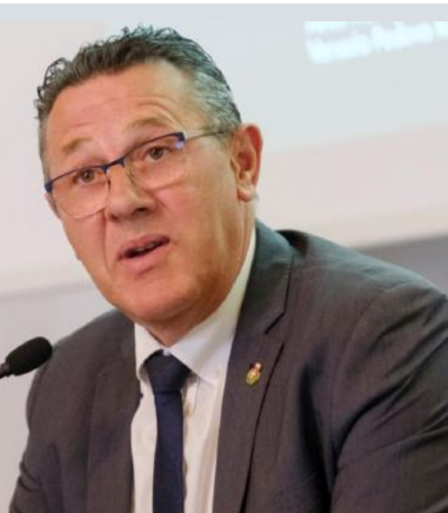
presidente della Provincia di Treviso e sindaco del Comune di Castelfranco Veneto

esempio, porta il secco non riciclabile in un impianto apposito, dove il rifiuto è sottoposto a una serie di processi perché venga ridotto al minimo il materiale poi convertito in Css (combustibile solido secondario, ndr). Ma si parla di una percentuale di rifiuti veramente bassa».