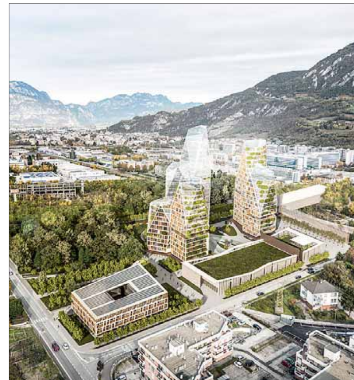
Le torri progettate sull'area Sequenza. A sinistra l'area di cautela del Pguap

progetto di bypass ferroviario, è tornato ieri sull'argomento per esprimere solidarietà ai tecnici. «Gli ultimi dati sulla contaminazione della falda a Trento Nord e in particolare sotto l'ex scalo ferroviario inte-