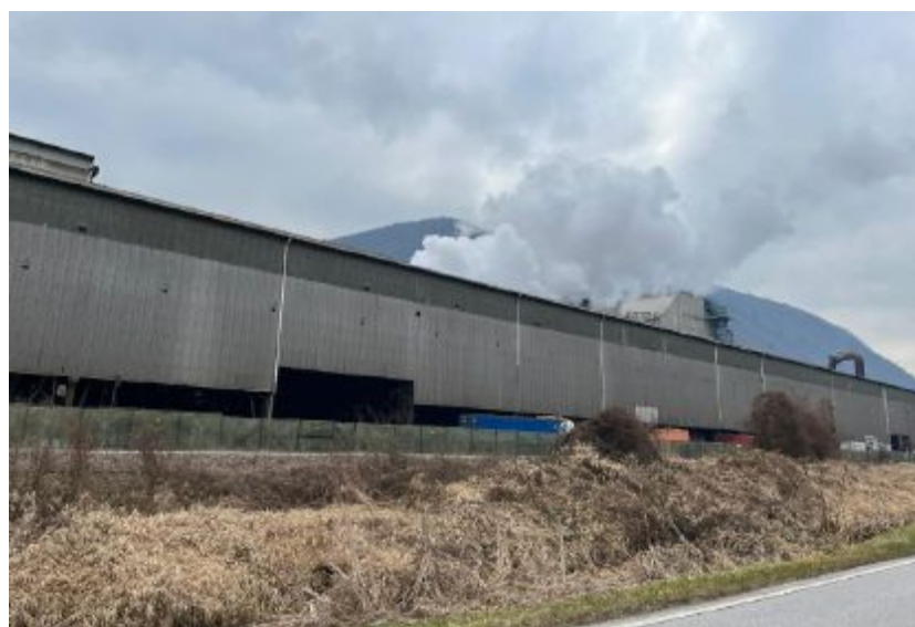
Lo stabilimento L'acciaieria di Borgo Valsugana è la principale fonte di emissioni climalteranti

L area urbana di Trento è responsabile del doppio delle emissioni di anidride carbonica equivalente (l'unità di misura che indica l'impatto sul riscaldamento globale di una certa quantità di gas serra espressa in tonnellate di anidride carbonica) rispetto a quella del capoluogo altoatesino. In numeri, parliamo di 108.888 tonnellate di anidride carbonica equivalente emesse dall'area urbana di Trento nel 2022 a fronte delle 55.599,3 tonnellate prodotte nello stesso anno da quella di Bolzano. Il dato, legato