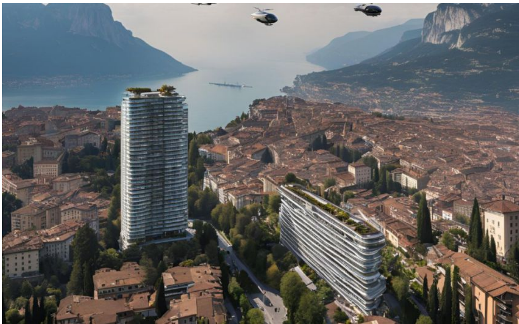
L'esercizio Grazie all'intelligenza artificiale, inserendo le necessità del territorio è stata elaborata un'immagine di come si potrebbe immaginare l'Alto Garda del futuro