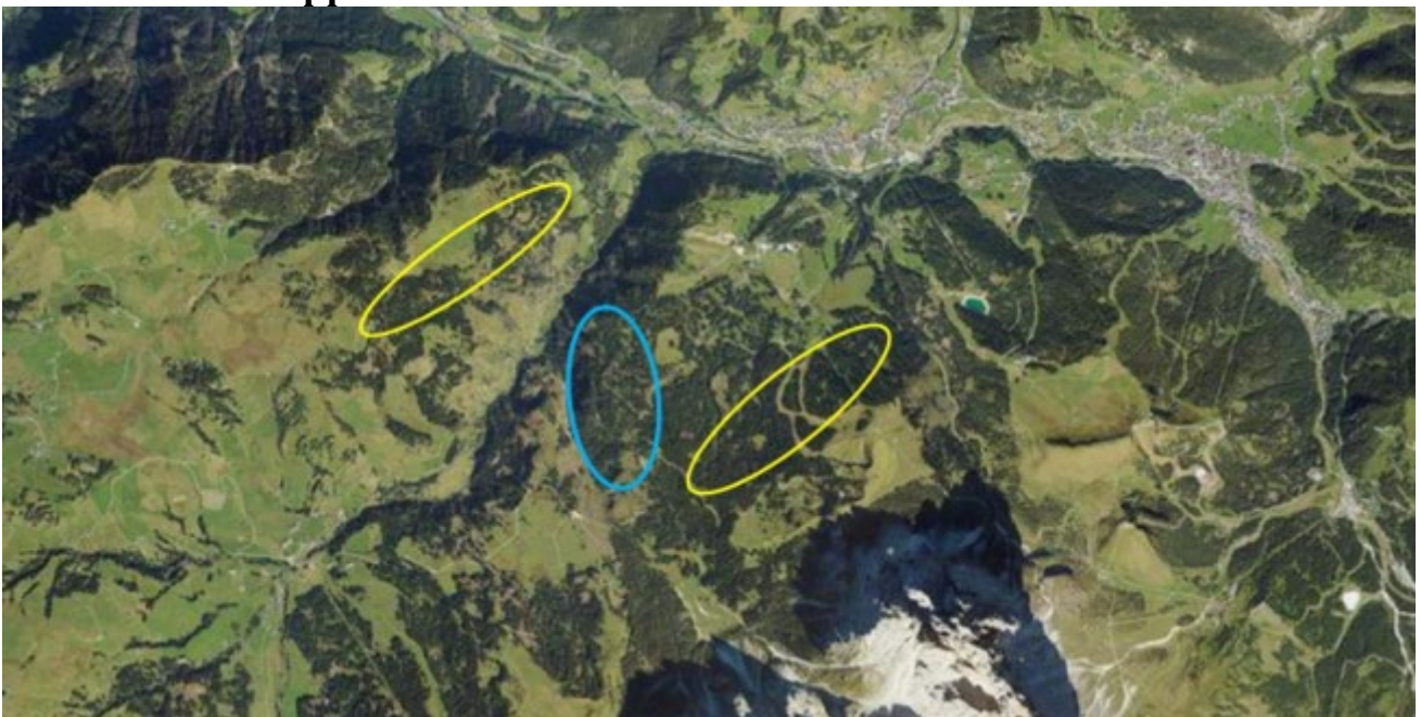
Distribuzione del gallo cedrone nell'area dell'Alpe di Siusi/Monte Pana. Le aree segnate in giallo e in blu sono le aree di accoppiamento del gallo cedrone.

L'opposizione al progetto ha visto crescere negli anni un movimento sempre più coeso, formato da residenti, ambientalisti e studiosi, preoccupati per le conseguenze ambientali di una nuova infrastruttura turistica in un'area naturale di grande valore. Gli studi condotti dall'AVK (Arbeitsgemeinschaft für Vogelkunde und Vogelschutz-Südtirol) hanno evidenziato la presenza di specie rare e vulnerabili, come il gallo cedrone e il raro orchidea pantofola della signora, che verrebbero gravemente minacciati da ulteriori sviluppi infrastrutturali.